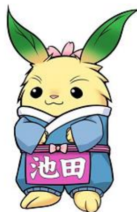
池田町キャラクター ちゃちゃまる