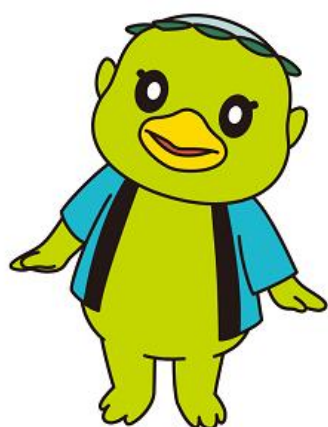
揖斐川町キャラクター かっぱの河太郎